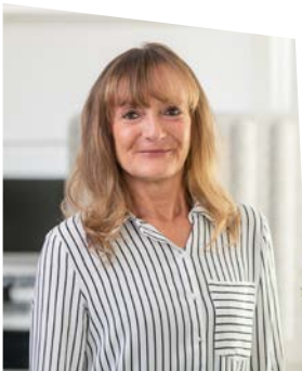
Eliane Bioly Bibliothek